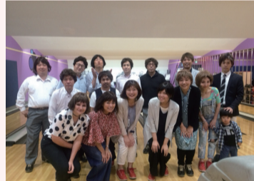
第1回は天神にてボーリング大会を開催!全員ウィッグをつけてのプレイ。みんな意外と似合っていました。(笑)