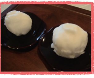
旬の野菜で かるかん