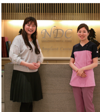
真摯な姿勢と柔らかな笑顔が魅力的でした!

永嶋歯科クリニック ● 診察日 月曜～金曜: 午前9時～午後6時 第1・3土曜: 午前9時～午後1時 ● 休診日 第2・4土曜、日曜、祝日 ● 所在地 〒810-0041 福岡県福岡市中央区 大名2-6-39 LANDICビル4F ● TEL 0120(507)507 ● URL http://www.ndc-dental.jp/