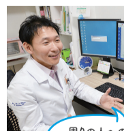
周りの人への リスペクト(敬意)を 大切にしています。

A 乳がんでの死亡率減少を目的に40歳からマンモグラフィ検診が推奨されています。日本では30代後半から乳がんが急増します。私は、早期発見のため、30歳からの自己検診、35歳からの定期的な乳がん検診をすすめています。家族が乳がんになったなどリスクのある方には、30歳から超音波検診をすすめています。乳房を板に挟むマンモグラフィは数秒間は多少の痛みは伴いますが、我慢できる範囲内であることがほとんどです。生理前を避けた方が痛みは少ないですよ。